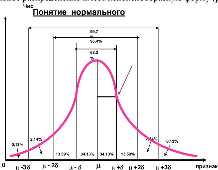
Рис. Кривая нормального распределения К.Гаусса

Нормальное распределение имеет колоколообразную форму (рис. 1).